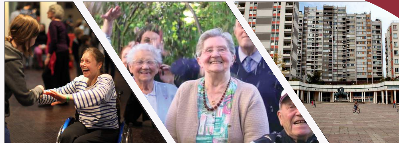
Personnes à mobilité réduite \ Personnes âgées \ Quartiers défavorisés

Vos salariés seront ravis de passer cette excursion avec des bénéficiaires peu habitués à sortir de leur cadre. Faites de la solidarité une marque forte de votre entreprise !