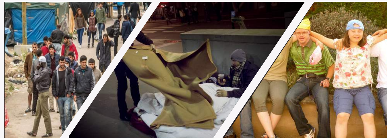
Réfugiés / Sans abri / Personnes atteintes de Trisomie